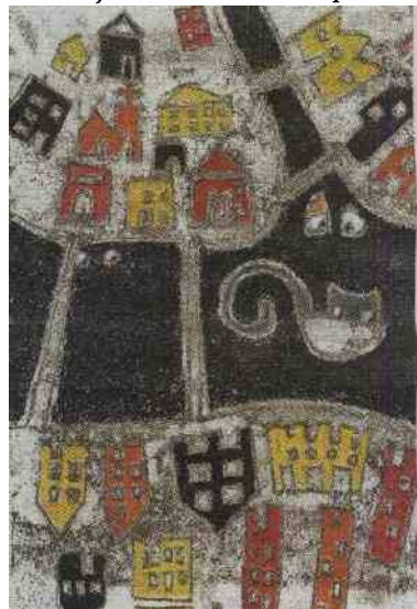
Iz slikanice Mala arhitekta, ki jo je avtorica tudi sama ilustrirala.