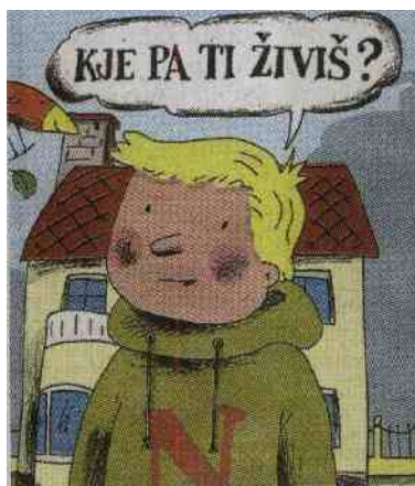
Prva: Kje pa ti živiš?