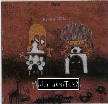
V povezavi z EPK: Mala arhitektka